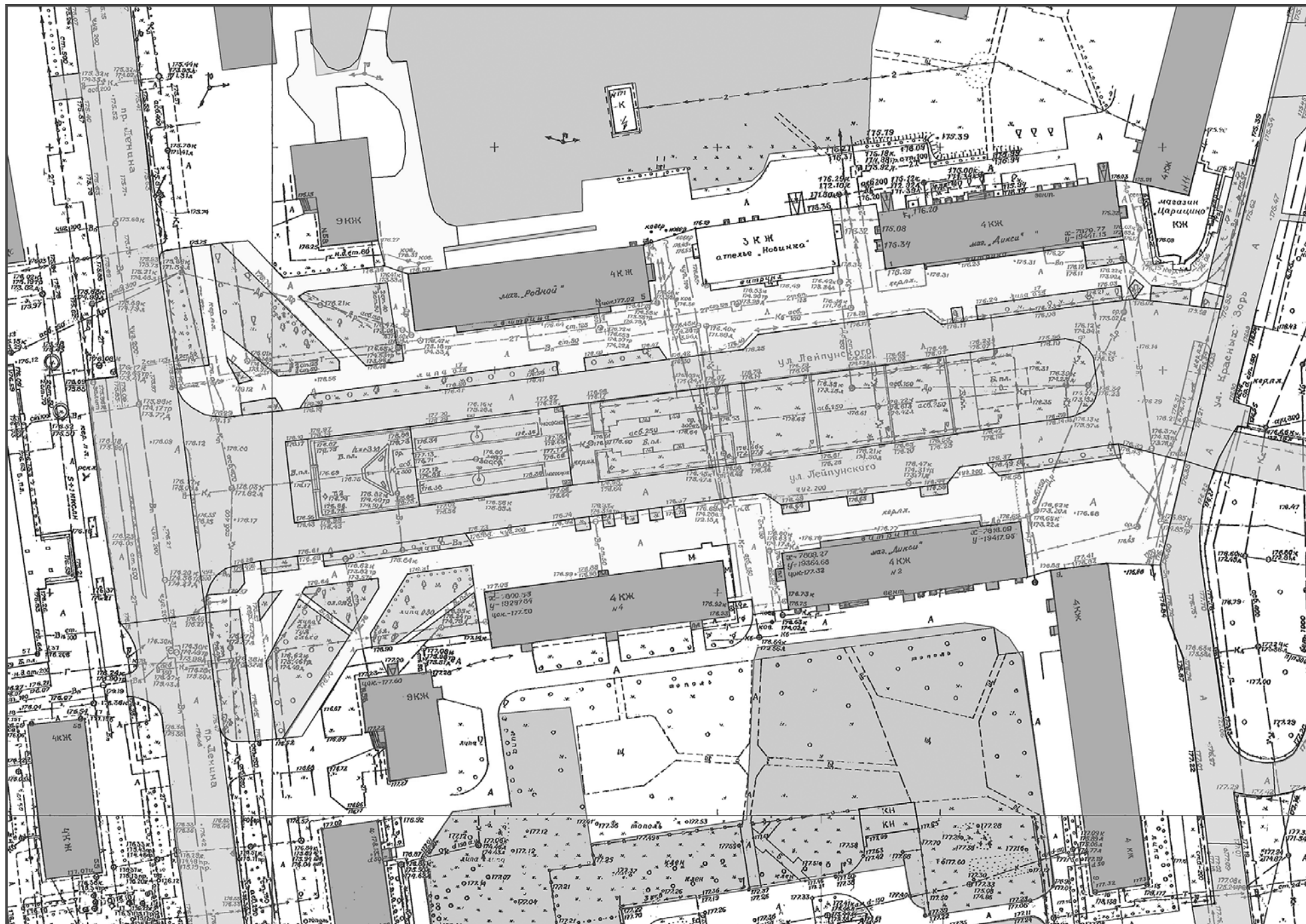
СХЕМА ГРАНИЦ РАЗРАБОТКИ ЭСКИЗНОГО ПРОЕКТА БЛАГОУСТРОЙСТВА ТЕРРИТОРИИ, РАСПОЛОЖЕННОЙ ПО УЛ. ЛЕЙПУНСКОГО Г. ОБНИНСКА (УЧАСТОК ОТ ПР. ЛЕНИНА ДО УЛ. КРАСНЫХ ЗОРЬ)

Приложение № 2 к Положению о проведении открытого публичного архитектурного конкурса на лучший эскизный проект благоустройства территории, расположенной по ул. Лейпунского г. Обнинска (участок от пр. Ленина до ул. Красных Зорь)