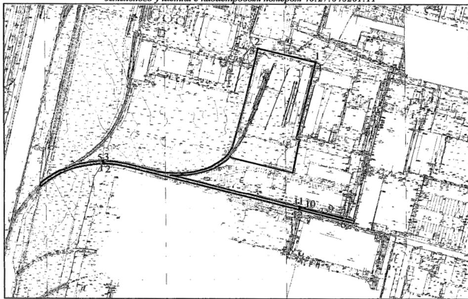
Схема расположения границ публичного сервитута в отношении земельного участка с кадастровым номером 40:27:040201:11