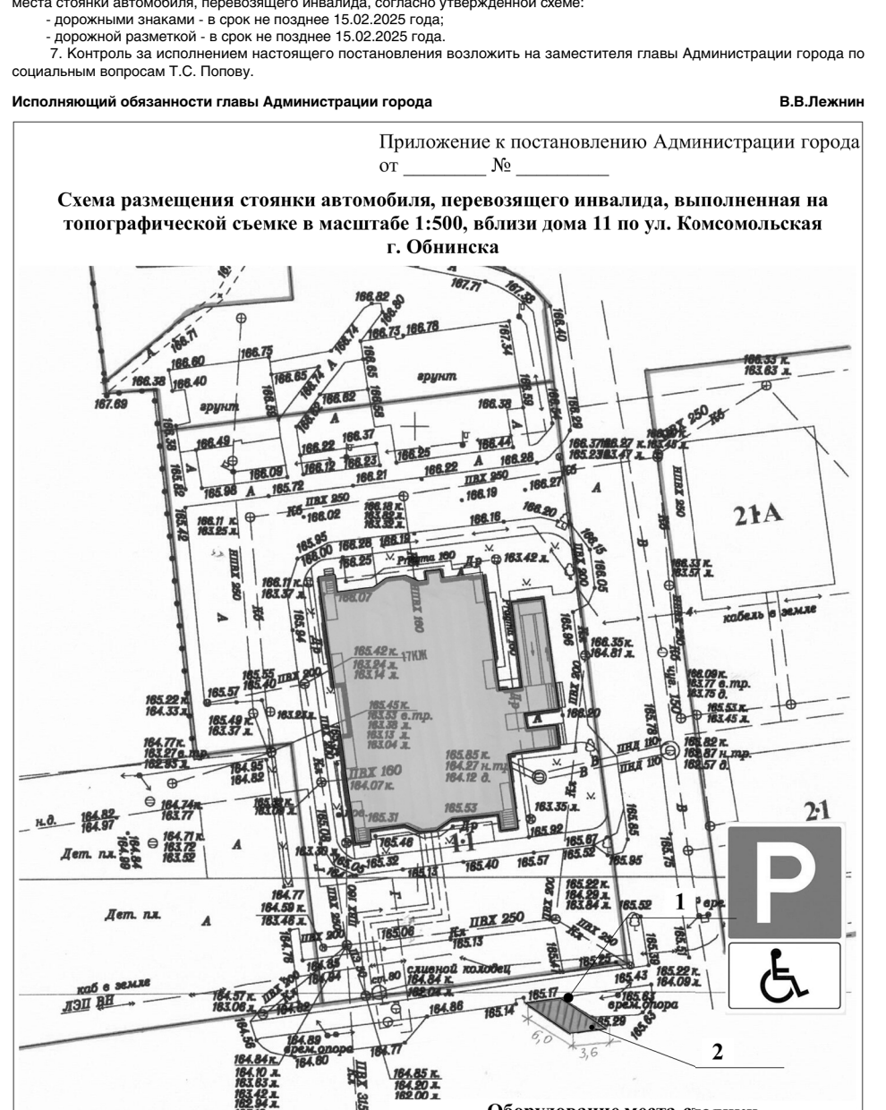
Схема размещения стоянки автомобиля, перевозящего инвалида, выполненная на топографической съемке в масштабе 1:500, вблизи дома 11 по ул. Комсомольская г. Обнинска

Приложение к постановлению Администрации города от _____ № _____